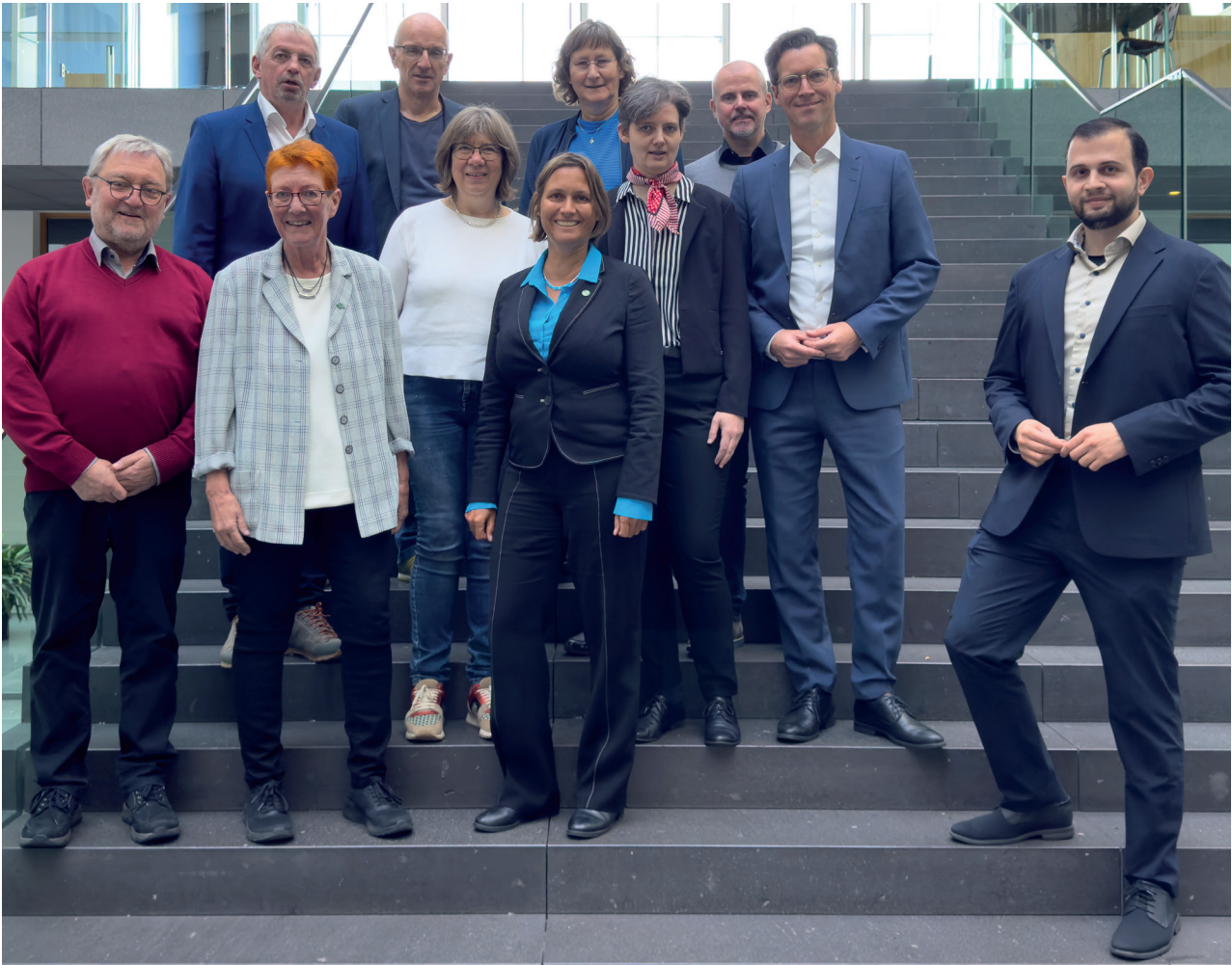
Foto vom informellen Verbändeaustausch im Haus der Bundespressekonferenz