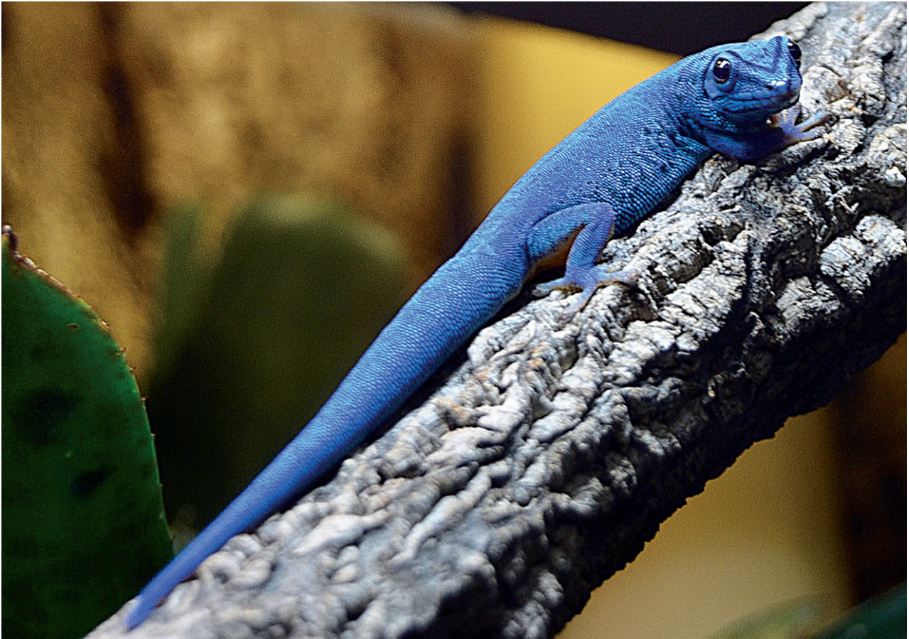
Anhang I - Art: Himmelblauer Zwerggecko ( Lygodactylus williamsi )

biologischen Systematik gab oder die Tiere so lange in menschlicher Obhut gezüchtet worden sind, dass es keine Nachweise mehr über erste Importe in die EU gibt.