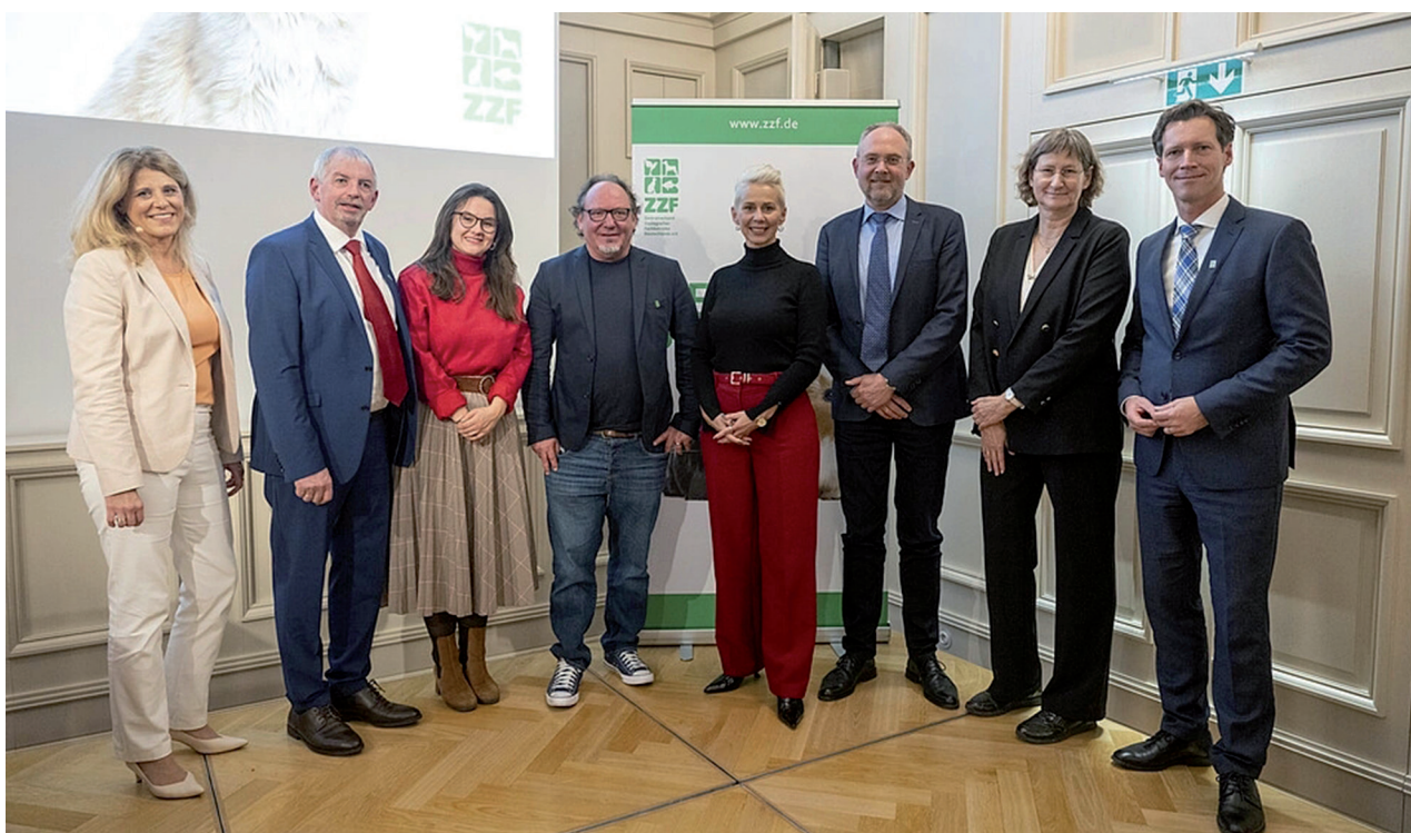
Parlamentarischer Abend des ZZf in Berlin

Im weiteren Verlauf des Abends fanden viele konstruktive Gespräche mit Verbandsvertreterinnen und -vertretern wie auch mit der Parlamentarischen Staatssekretärin im BMLEH und Bundesbeauftragte für Tierschutz Silvia Breher statt. Wir danken dem ZZf für die Ausrichtung einer überaus wichtigen Veranstaltung. ■