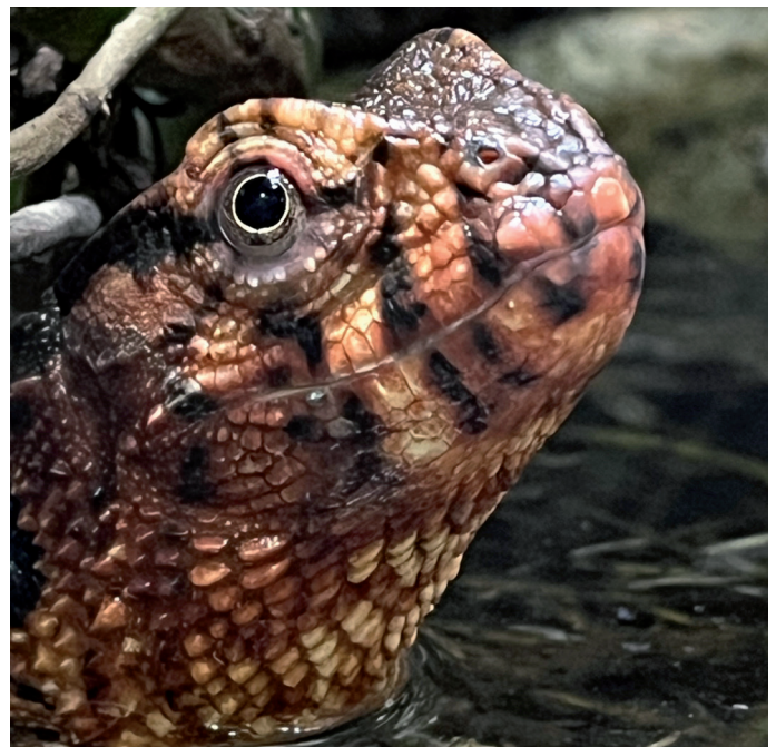
Anhang I - Arten: Graupagei ( Psittacus erithacus ), Chinesische Krokodilschwanzzechse ( Shinisaurus crocodilurus )

Im weiteren Verfahren erfolgt eine Prüfung durch die wissenschaftliche Behörde des BfN, ob die Zucht in menschlicher Obhut nachvollziehbar ist. Werden der rechtmäßige Erwerb und die Prüfung der Zucht durch das BfN positiv beschieden, wird der Antrag an das CITES-Sekretariat weitergeleitet. Erfolgt dort ebenfalls eine positive Entscheidung, wird die geplante Registrierung eines Zuchtbetriebs durch eine Notifikation auf der CITES-Webseite veröffentlicht.